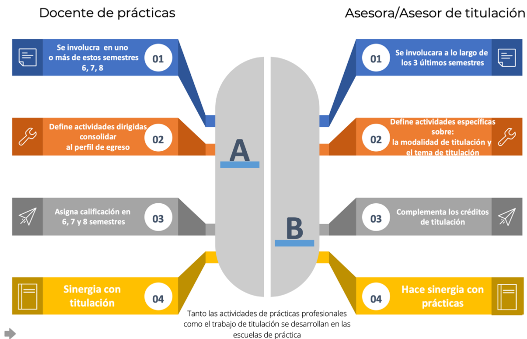
Fig. 4. Énfasis de docentes y asesores de titulación

El proceso de titulación se describe, de manera ampliada, en los documentos que están disponibles en la Página Web de la DGESuM: